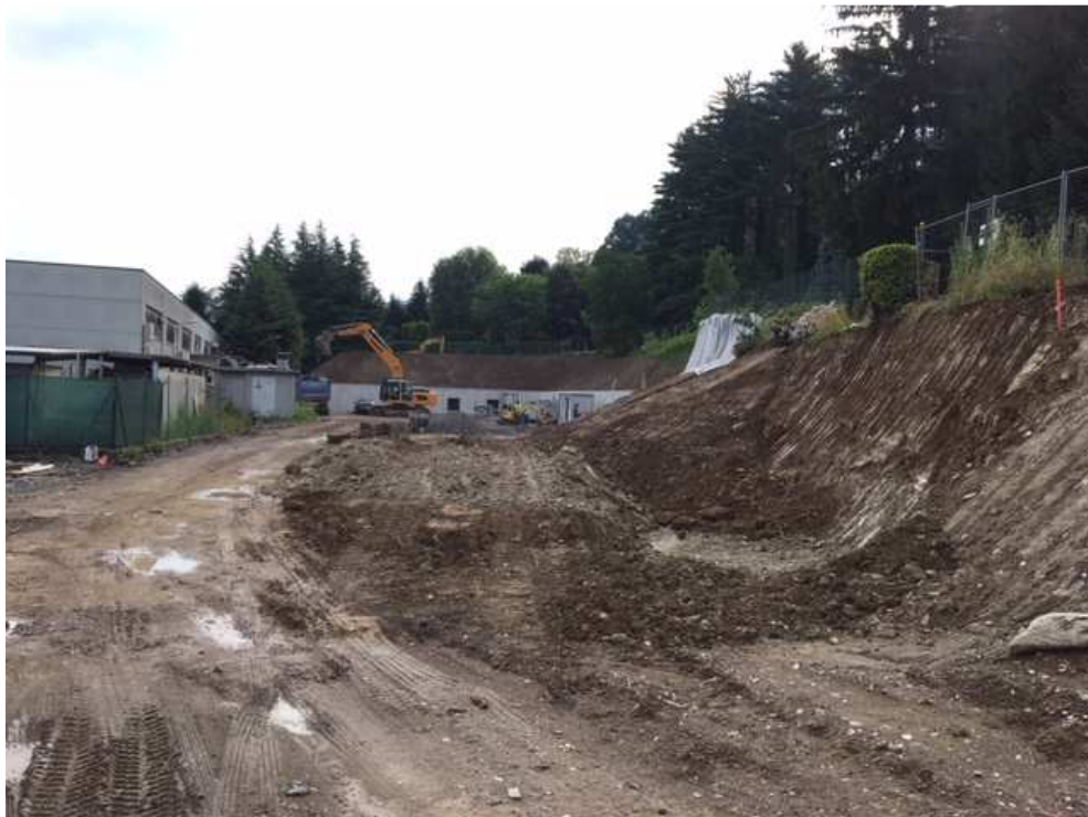
Vista dello spazio prima occupato dalle case demolite