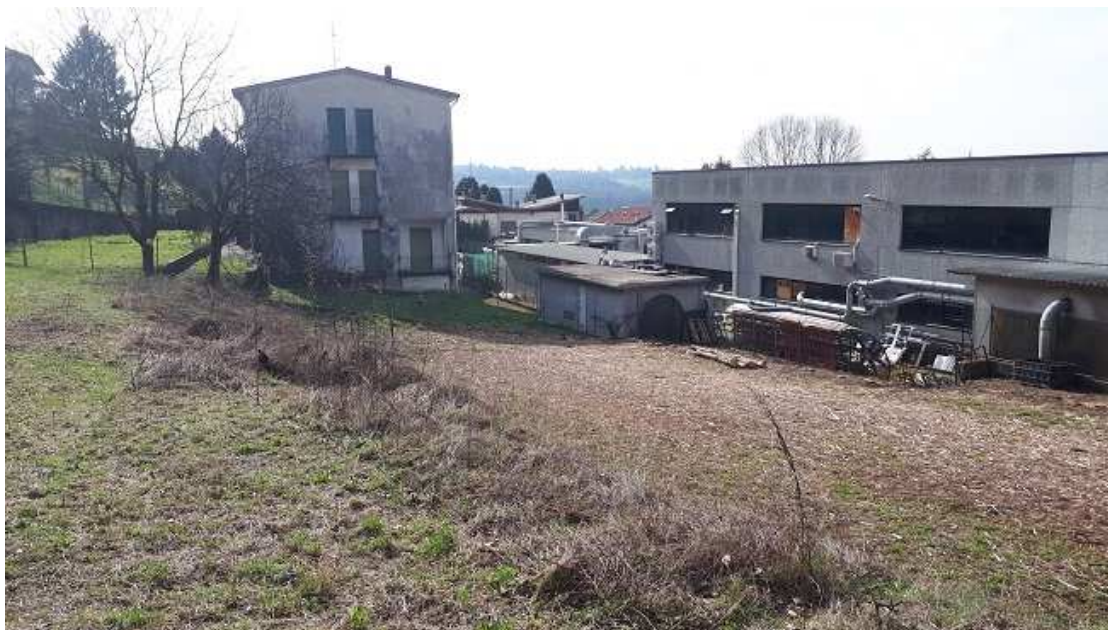
Vista prima dei lavori dell'area di scavo A sinistra gli edifici residenziali poi demoliti