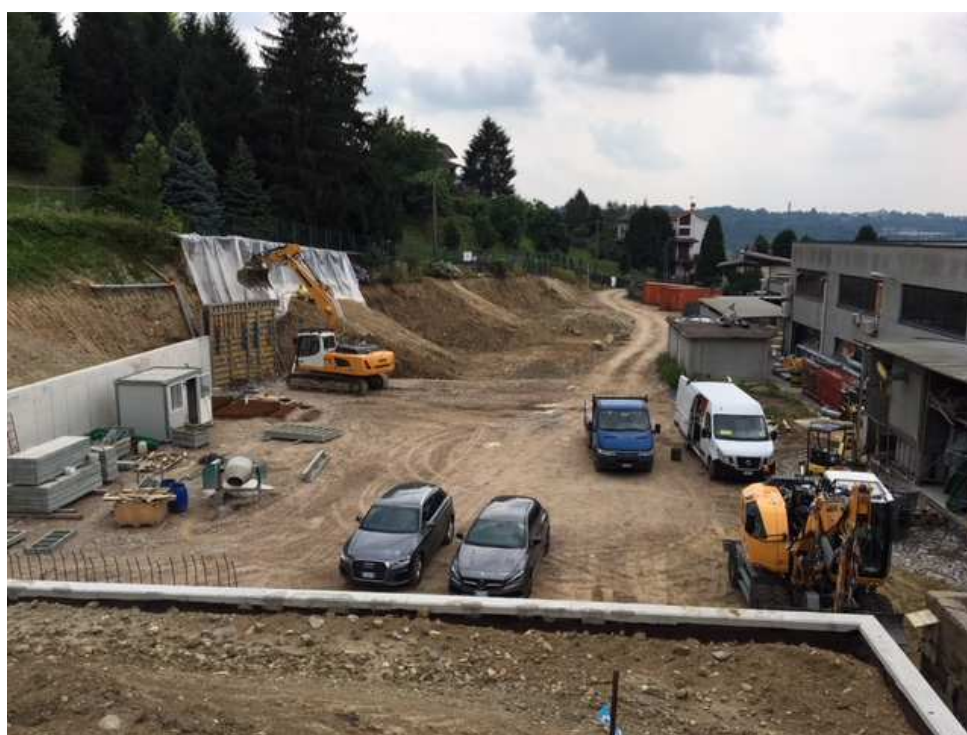
Vista dei muri di sostegno in esecuzione e dello spazio liberato dagli edifici demoliti