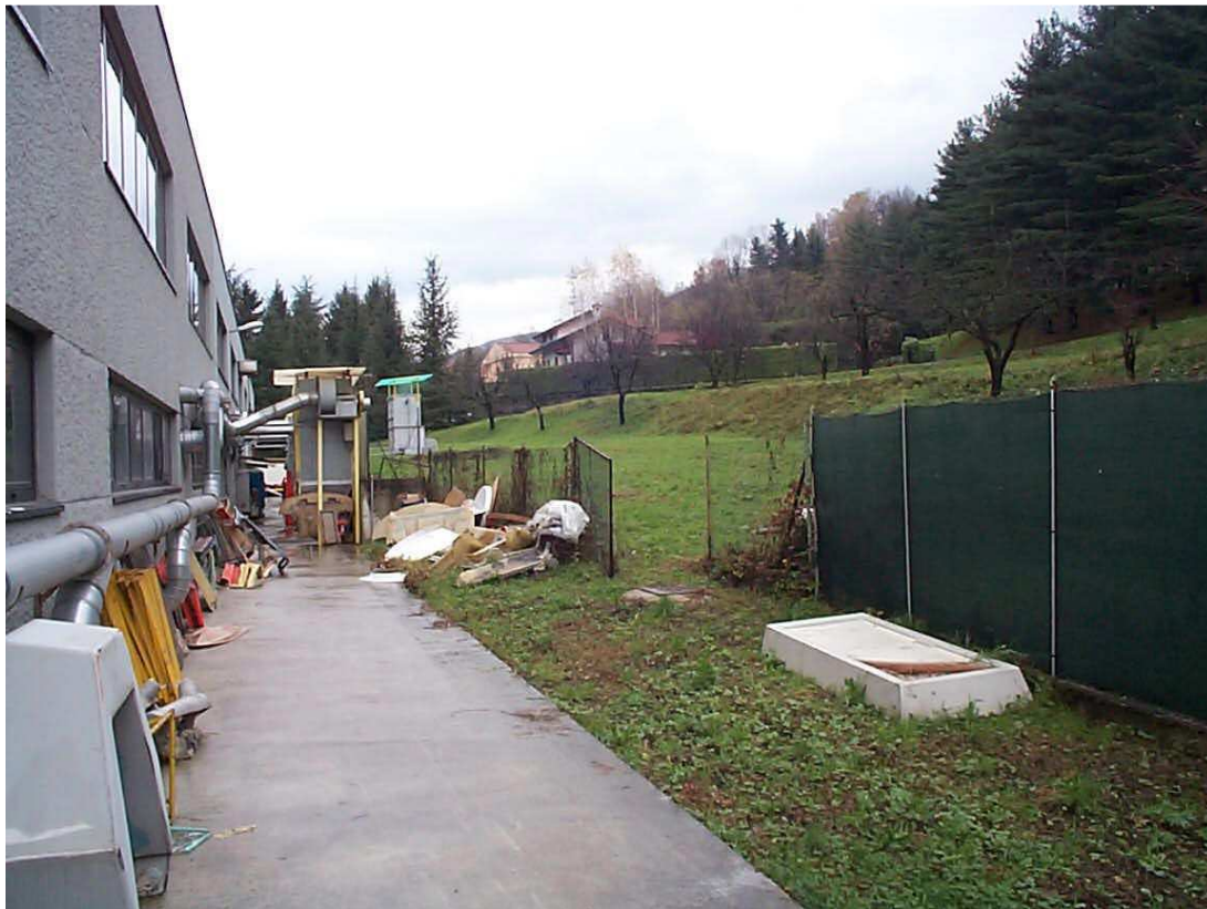
Vista prima dei lavori dell'area di scavo