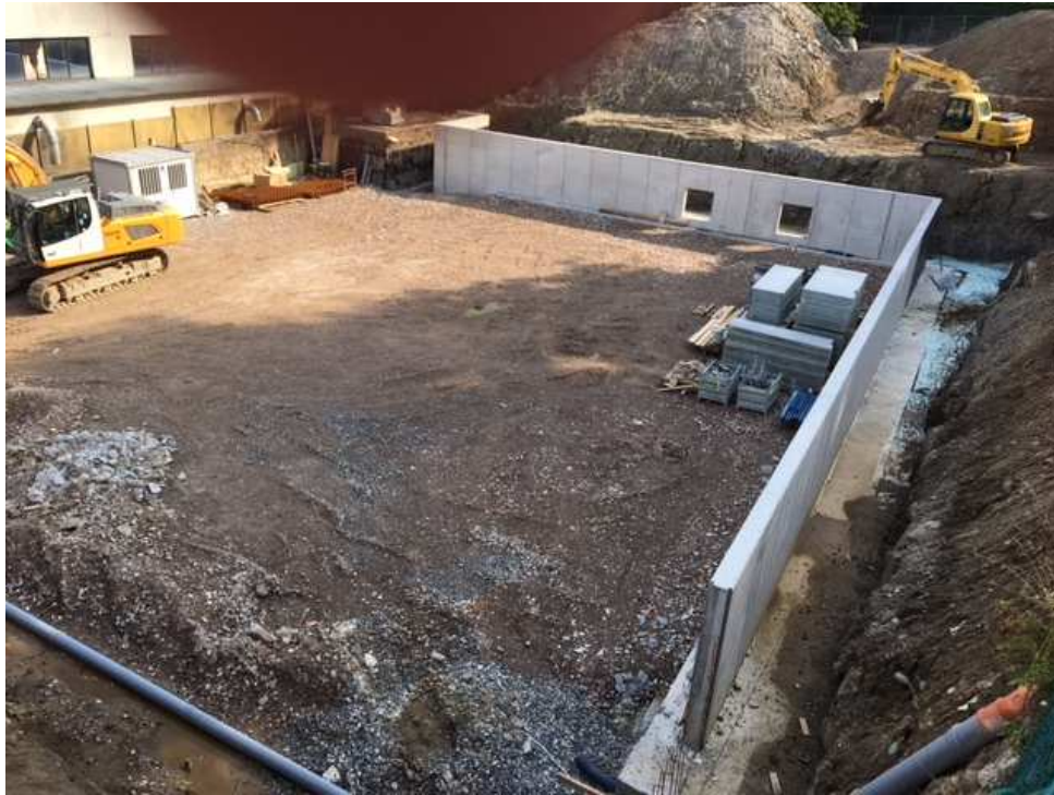
Vista dei muri di sostegno