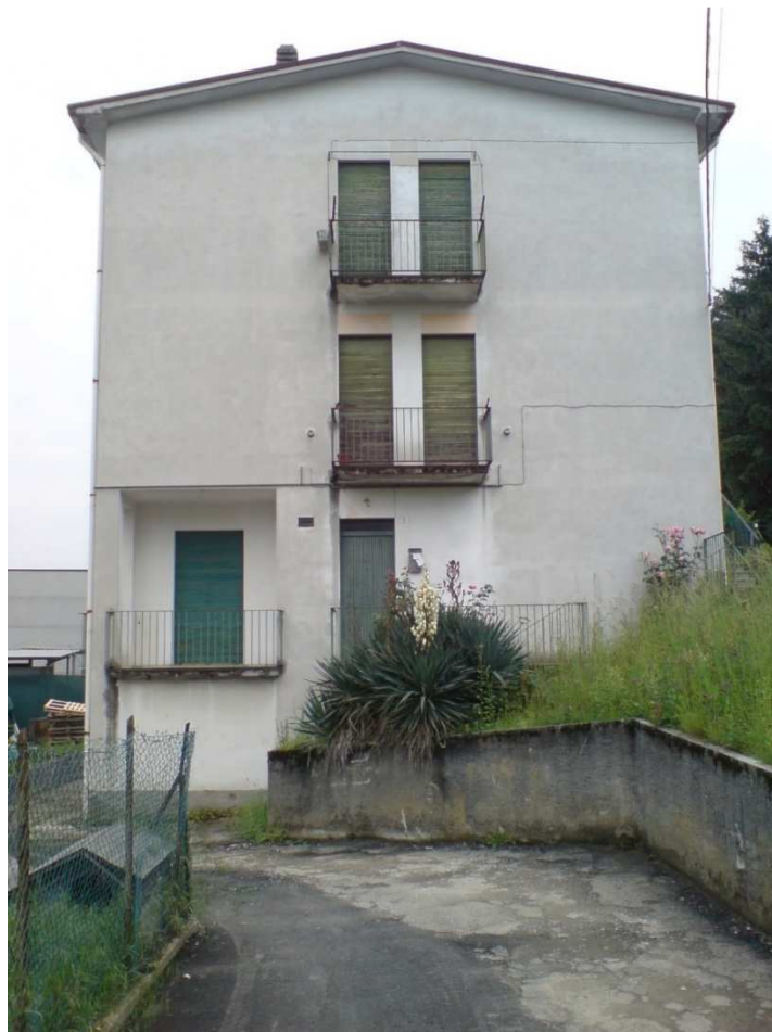
Gli edifici residenziali poi demoliti