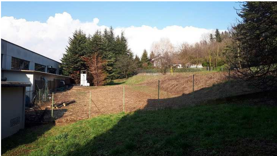
Vista prima dei lavori di sbancamento