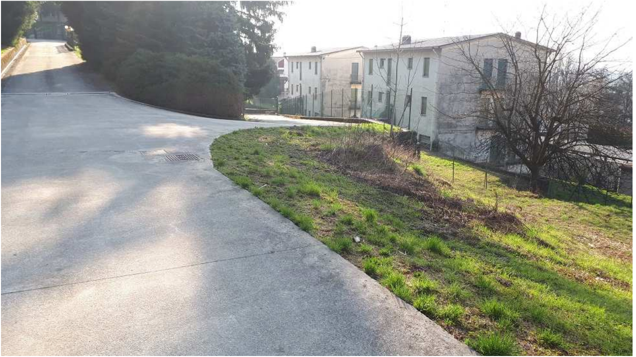
Gli edifici residenziali poi demoliti