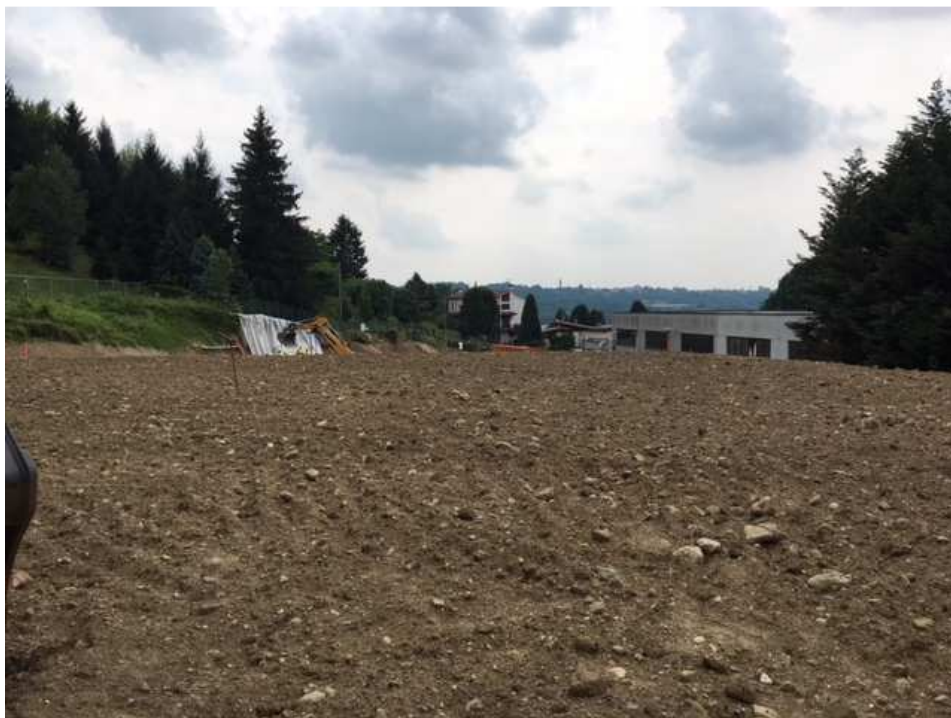
Vista riempimento eseguito